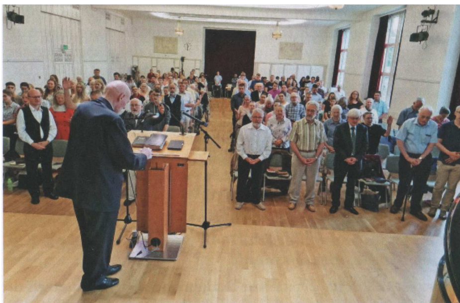
Фото собрания в Цюрихе в воскресенье 28 июля 2019 года