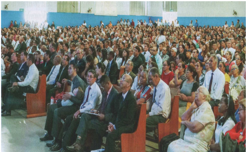
В Пасхальное воскресенье 22 апреля 2019 года в Койани, Бразилия (1 пол. фото)