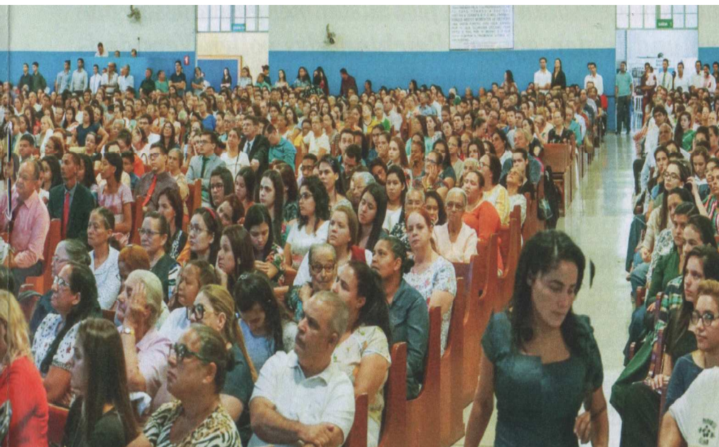
(2 пол. фото) на богослужение собрались многие верующие из всей страны.