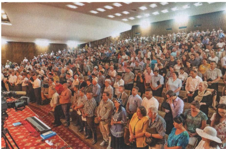
Собрание в Румынии в субботу 22 июня 2019 года