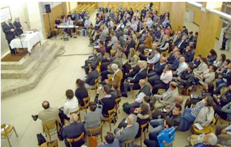
Zhromaždenie v Ríme.