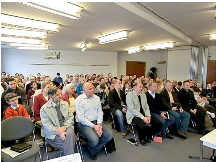
Fotografia zo zhromaždenia v Grazi v Rakúsku.