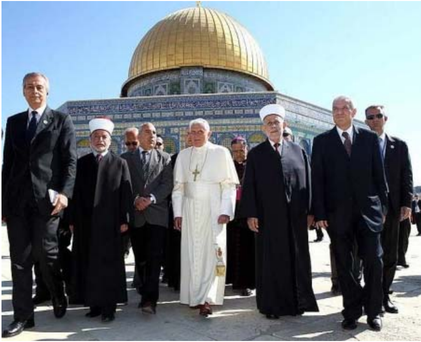
O fotografie cu Papa și reprezentanții palestinieni în fața Domului Stâncii pe Muntele Templului

pe care Biblia îl numește legământ: „ El va face un legământ trainic cu mulți timp de o săptămână... ”. (Daniel 9:27)