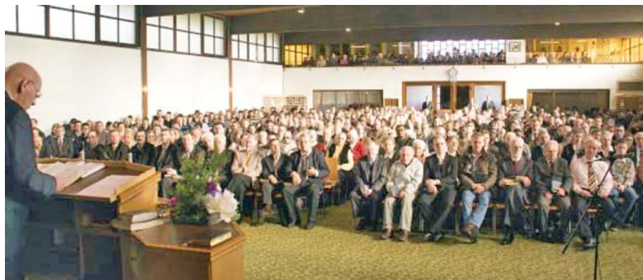
O fotografie a adunării din 5 februarie 2012, la Centrul de Misiune din Krefeld, Germania

Puteți să ascultați în direct, prin internet, adunările noastre lunare în primul sfârșit de săptămână al fiecărei luni – sâmbătă la ora 19:30 și duminică la ora 10:00 ora Europei Centrale (ora 20:30 și 11:00 pentru România). Adunările sunt transmise în lumea întreagă, în 12 limbi - [inclusiv în limba română - n.tr.]. Să aveți parte de ceea ce face Dumnezeu în prezent conform planului Său de mântuire!