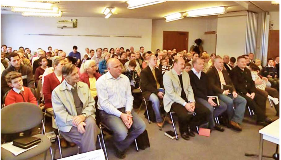
Adunarea din Graz, Austria