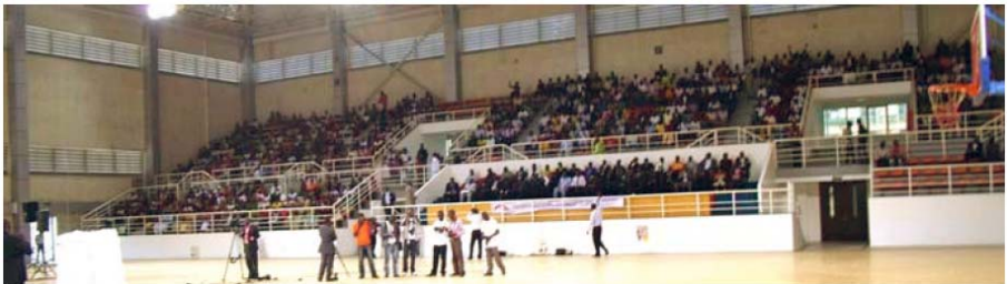
O parte din mulțimea adunată pe un stadion din Luanda, Angola