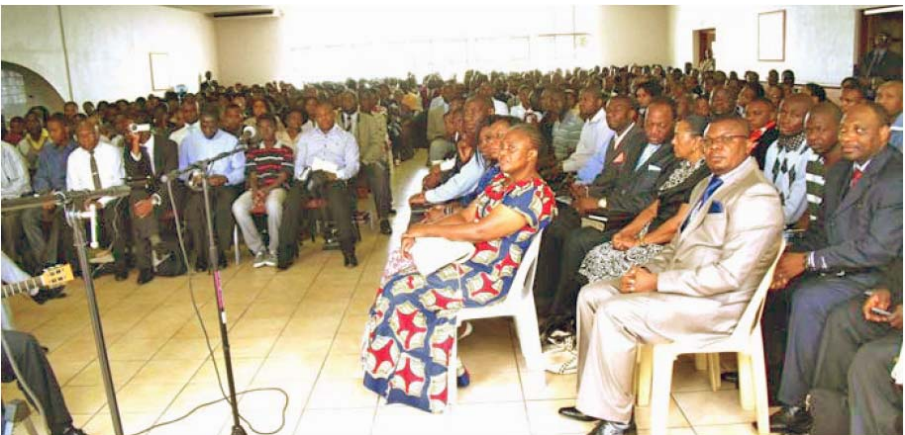
O adunare în Johannesburg