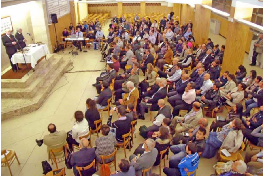
Adunarea din Roma, Italia