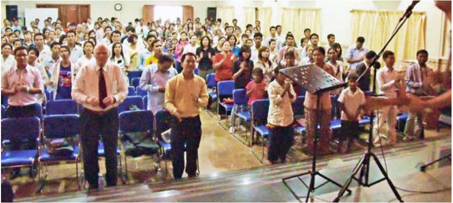
O fotografie din Phnom Penh, Cambodgia