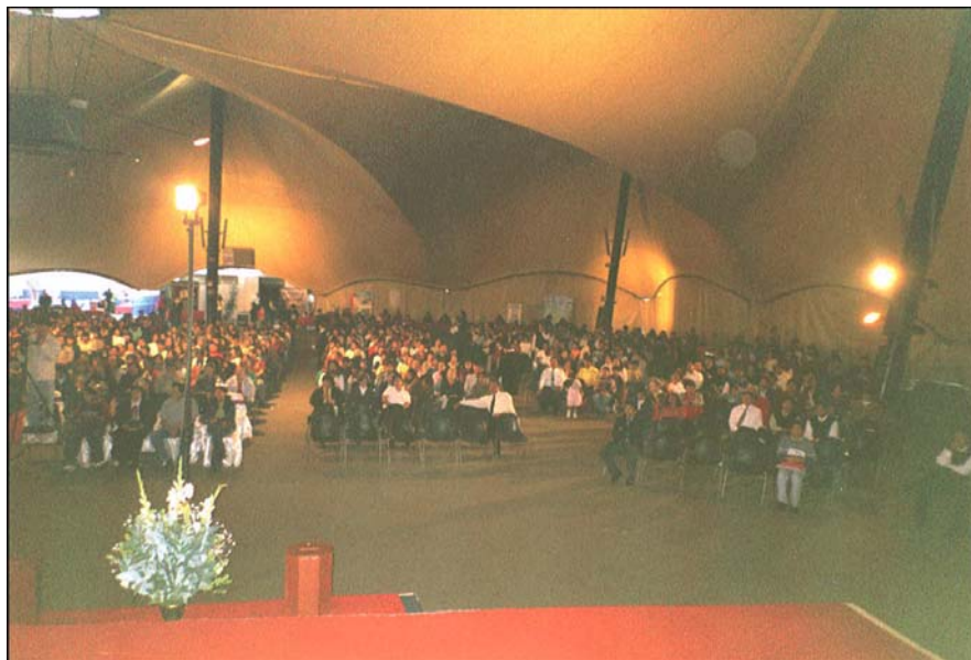
O adunare în Lima, Peru, Octombrie 2005.