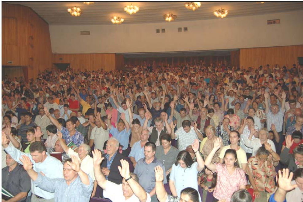
O fotografie a întâlnirii din August 2006 din România. În această ediție putem publica numai câteva dintre multele imagini pe care le avem din întreaga lume.