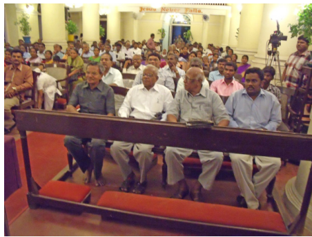
Két kép, az Indiában élő testvéreimmel és testvérnőkkel.