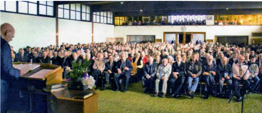
Valokuva Missionszentrumissa 5. helmikuuta 2012