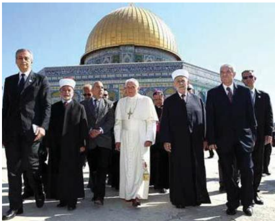
Paavi ja palestiinalaisedustajat kalliomoskeijan edessä Temppevivuorella

30. tammikuuta 2012 kertoi „Tuomiokirkkoradio”, Kölnin arkkihiippakunnan lähetys, neuvotteluista Vatikaanin ja palestiinalaisten välillä. Niissä on kyse jostakin perustus-sopimuksesta, jolle katolisen kirkon oikeudet Itä-Jerusalemissa ja palestiinalaisalueilla tullaan vahvistamaan.