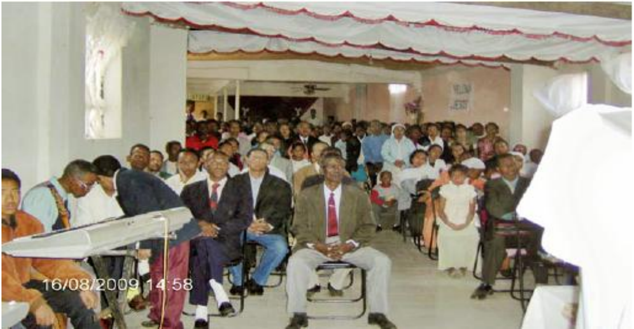
Kokous Madagaskarissa 16 elokuu 2009