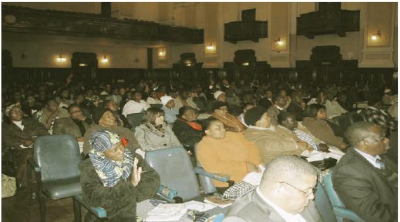
Kokous Johannesburgissa 17. elokuu 2009

...niin käy myös sanan, joka minun suustani lähtee: se ei tyhjänä palaa vaan täyttää tehtävän, jonka minä sille annan, ja saa menestymään kaiken, mitä varten sen lähetän. (Jes 55:11)