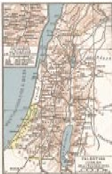
Ein Ausschnitt des Zwölf-Stämme-Landes westlich und östlich des Jordans. Direkt am Mittelmeer ist der 40 km lange Gaza-streifen — das Land der Philister.

In Josua 13 lesen wir: „... und von dem Lande sind sehr viele Teile bisher noch unerobert geblieben. Dies ist das noch uneroberte Land: sämt-