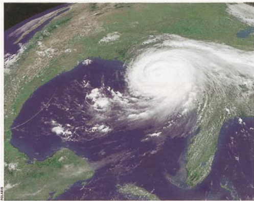
Satellitenaufnahme von Hurrikan „Katrina“: Rotierendes Ungeheuer

Was wir jedoch dann aus den USA, besonders aus New Orleans und den drei betroffenen Bundesstaaten in der Berichterstattung zu hören und zu sehen bekommen haben,