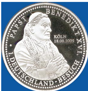
Durch die Prägung einer Sondermünze geht der Papstbesuch sichtbar in die Geschichte ein.

Unvorstellbar, dass im Volke Israel Abraham oder Moses oder irgendeiner der verstorbenen Propheten angefleht worden wäre! Ebenso undenkbar wäre eine solche Menschenverehrung im Urchristentum gewesen. Kann sich jemand vorstellen, dass Petrus, Jakobus oder Jo-